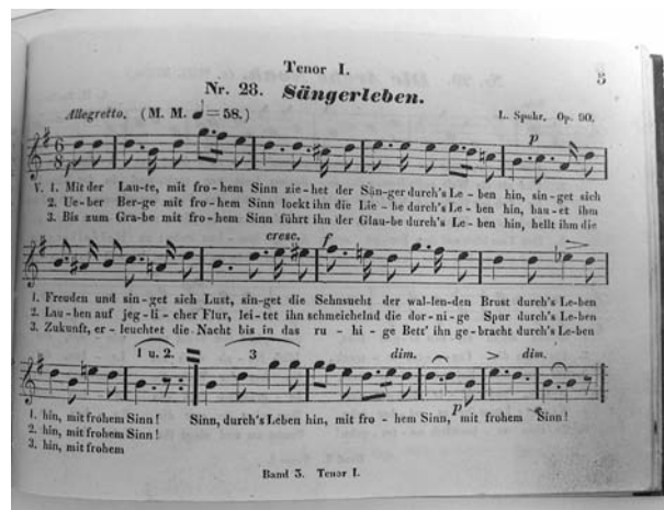
Sängereben, komponiert 1833