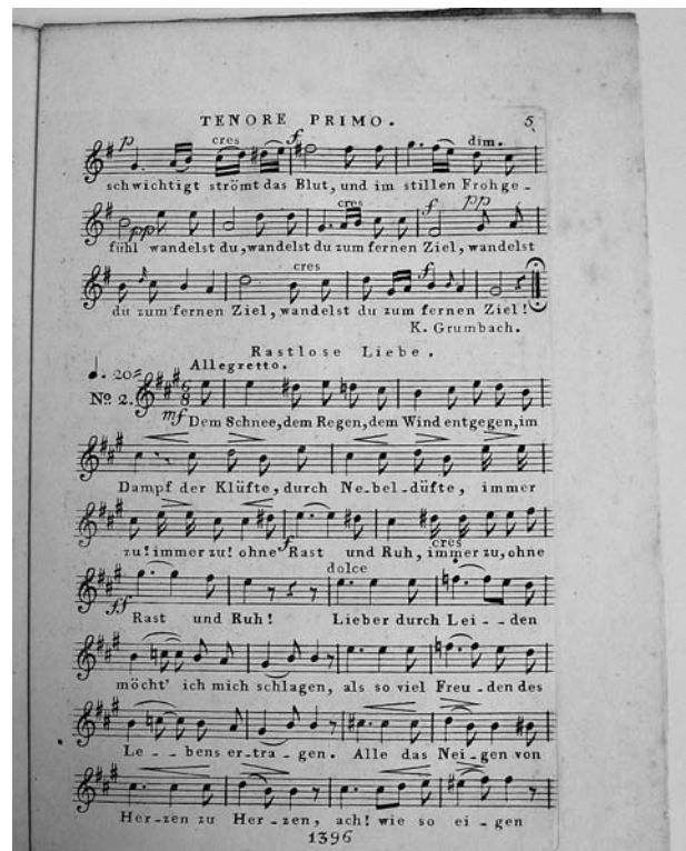
Rastlose Liebe (Text: Johann Wolfgang von Goethe)

Die Spohrsche Chorkreation gab der Idee, in Kassel weitere Chorvereinigungen zu schaffen, Gewicht. 1830 half Louis Spohr, die „Liedertafel“ zu bilden. Auch der Antritt solcher Vereine wie „Euterpe“ und „Harmonie“ zeugen von Ausstrahlung seiner Chorarbeit.